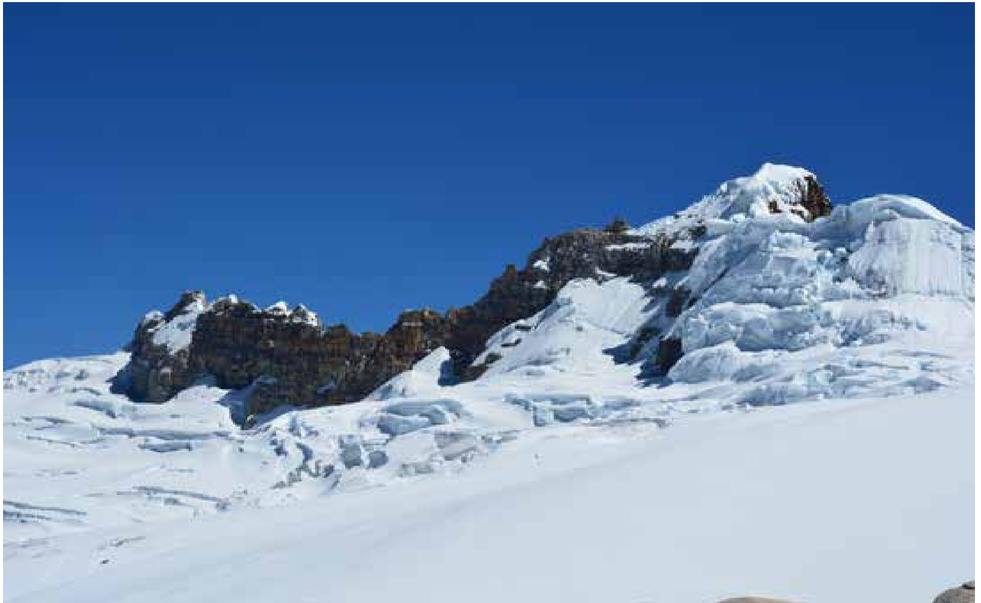
Sierra Nevada de Güicán, en el Nevado del Cocuy