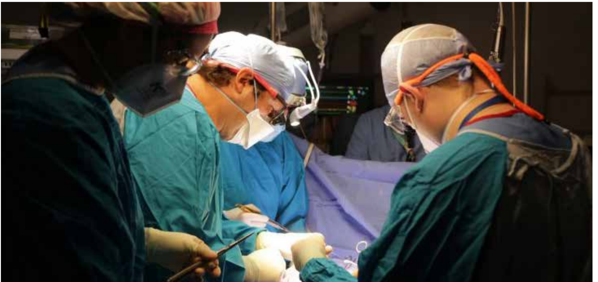
Operación del corazón

E l corazón no da espera y el llamado es a recibir oportunamente atención médica experta para su diagnóstico, tratamiento y óptima recuperación es la recomendación de las autoridades sanitarias de Colombia.