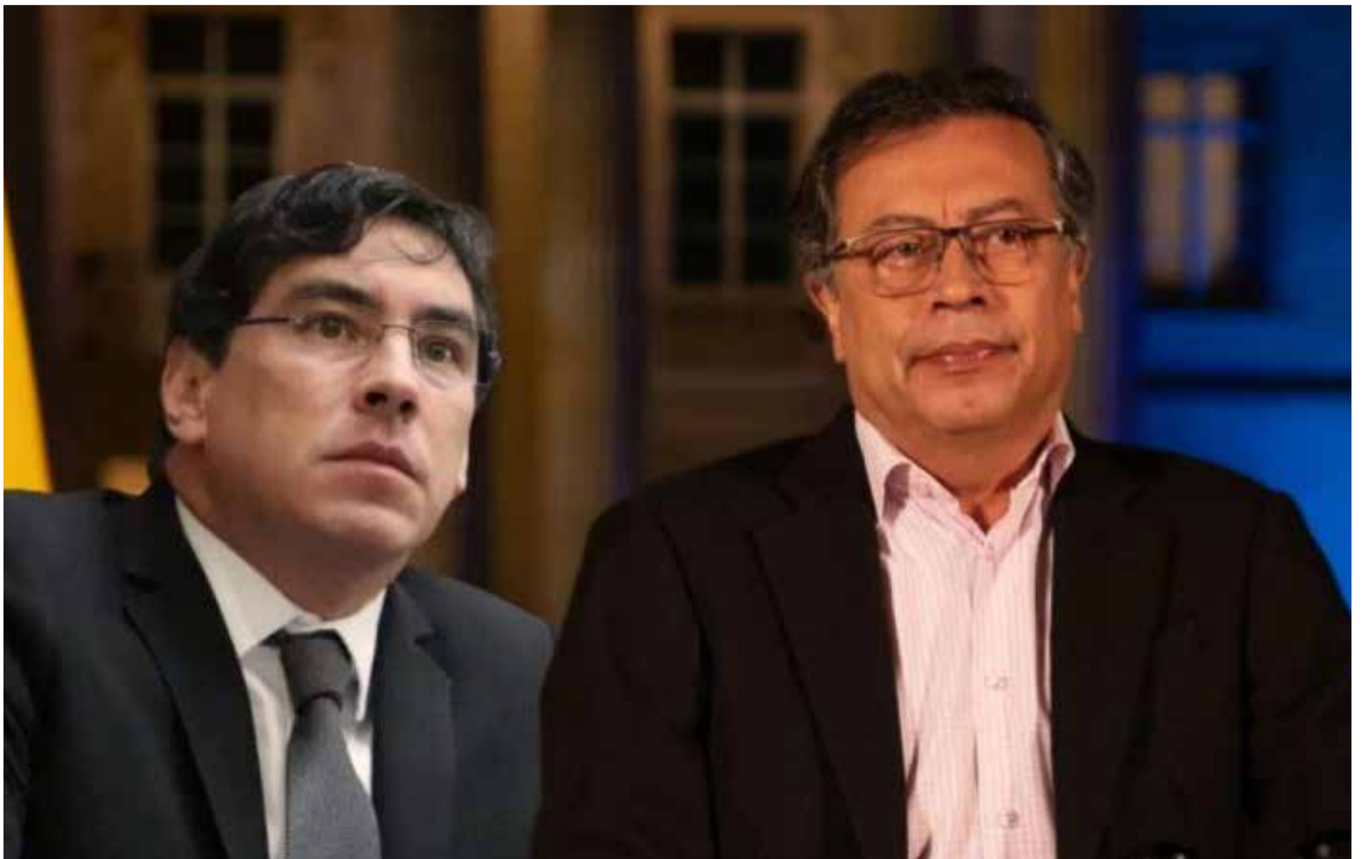
Petro derrota a Alvaro Prada en un enfrentamiento que pasó del plano político al plano personal.

La Corte Constitucional de Colombia ha ordenado la suspensión de los efectos de la decisión del Consejo Nacional Electoral (CNE) que determinó su competencia para investigar la financiación de la campaña presidencial de Gustavo Petro. Esta decisión marca un giro significativo en el proceso que buscaba esclarecer presuntas irregularidades en la financiación de la campaña del actual mandatario.