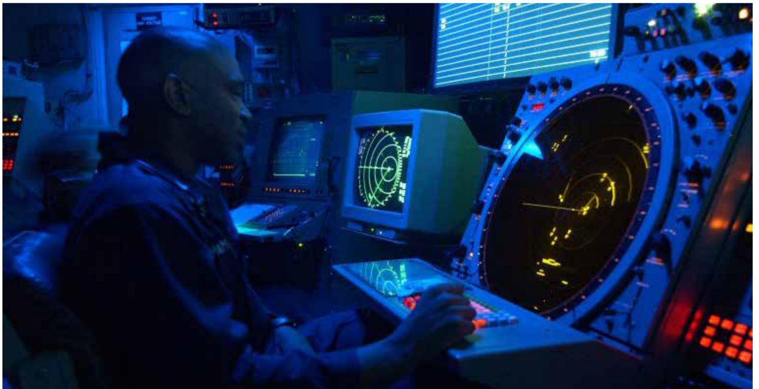
Humanos detectando Ovnis en el espacio

Sin agujeros de gusano, sólo nos quedan los vecinos próximos