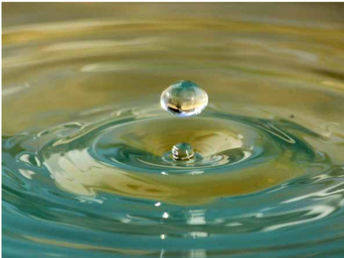
Naciones Unidas aprobó una resolución que reconoce al agua potable y al saneamiento básico como derecho humano esencial para el pleno disfrute de la vida y de todos los derechos de la humanidad.

Su importancia está relacionada con la regulación de los flujos de agua, pues debido a la composición de sus suelos, estos actúan como una esponja que retiene grandes cantidades de agua