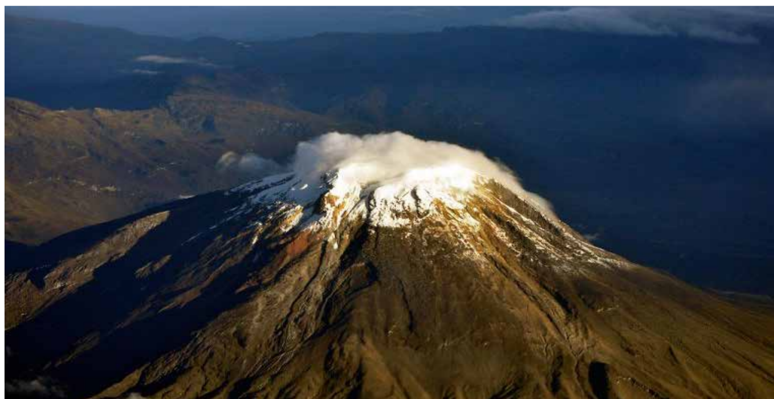
Nevado del Tolima

Impacto en las comunidades indígenas y campesinas: La reducción de agua afecta la agricultura, el turismo y la cultura de muchas comunidades.