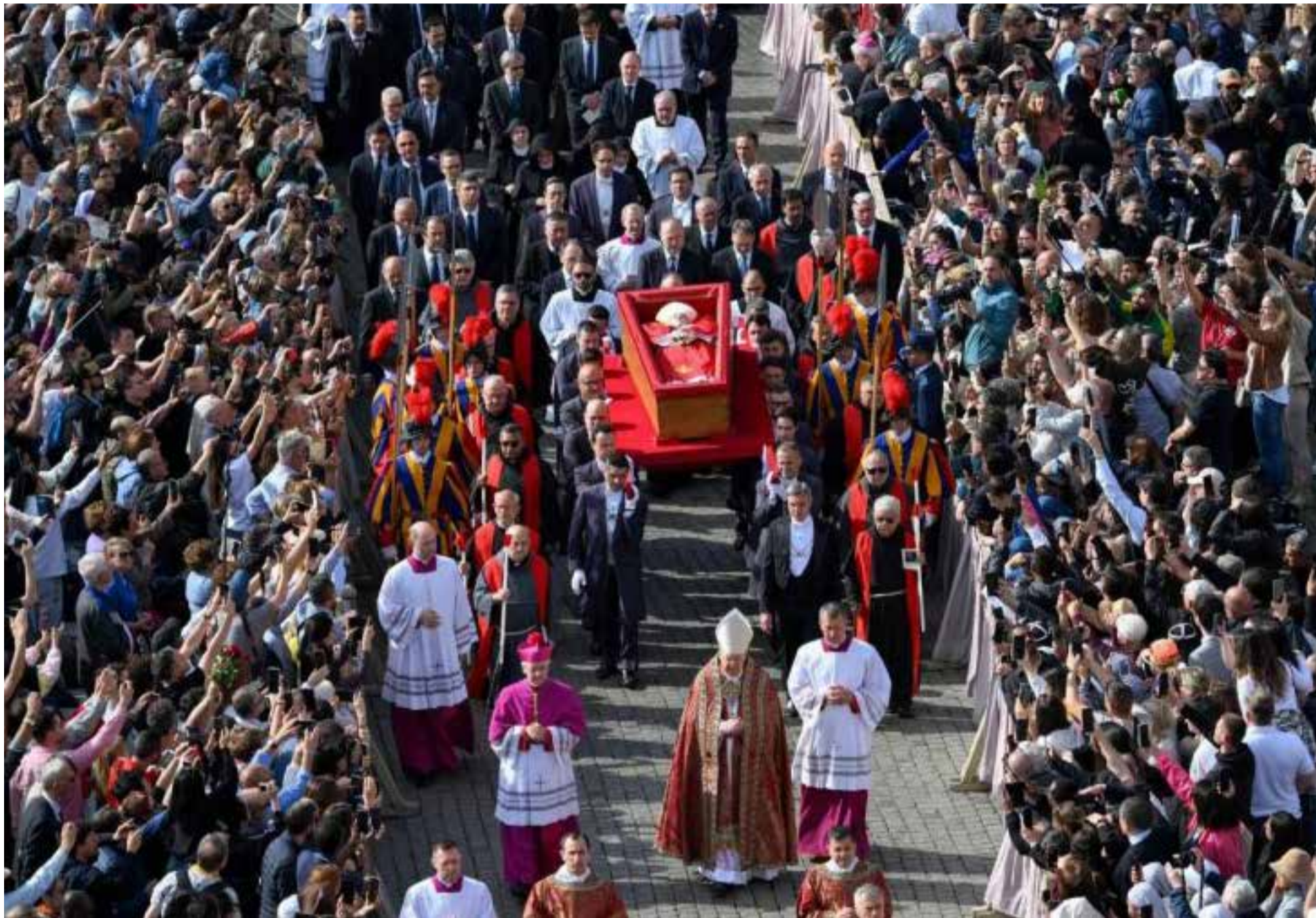
El mundo despide al Papa Francisco y se alista para elegir a su sucesor

M añana sábado, la Plaza de San Pedro del Vaticano se convertirá en el epicentro del mundo, al acoger el funeral del Papa Francisco. La Santa Sede confirmó la asistencia de 130 delegaciones, incluyendo 50 jefes de Estado o de Gobierno y 10 monarcas, para rendir homenaje al pontífice fallecido el lunes 21 de abril a los 88 años.