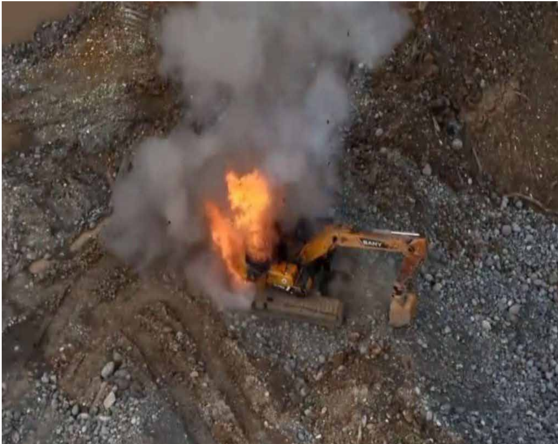
Maquinaria en la minería ilegal destruida por la fuerza pública.

P or instrucciones del gobierno nacional definió las acciones para garantizar los derechos fundamentales de los habitantes y contrarrestar el accionar de los grupos armados ilegales en esta zona del país.