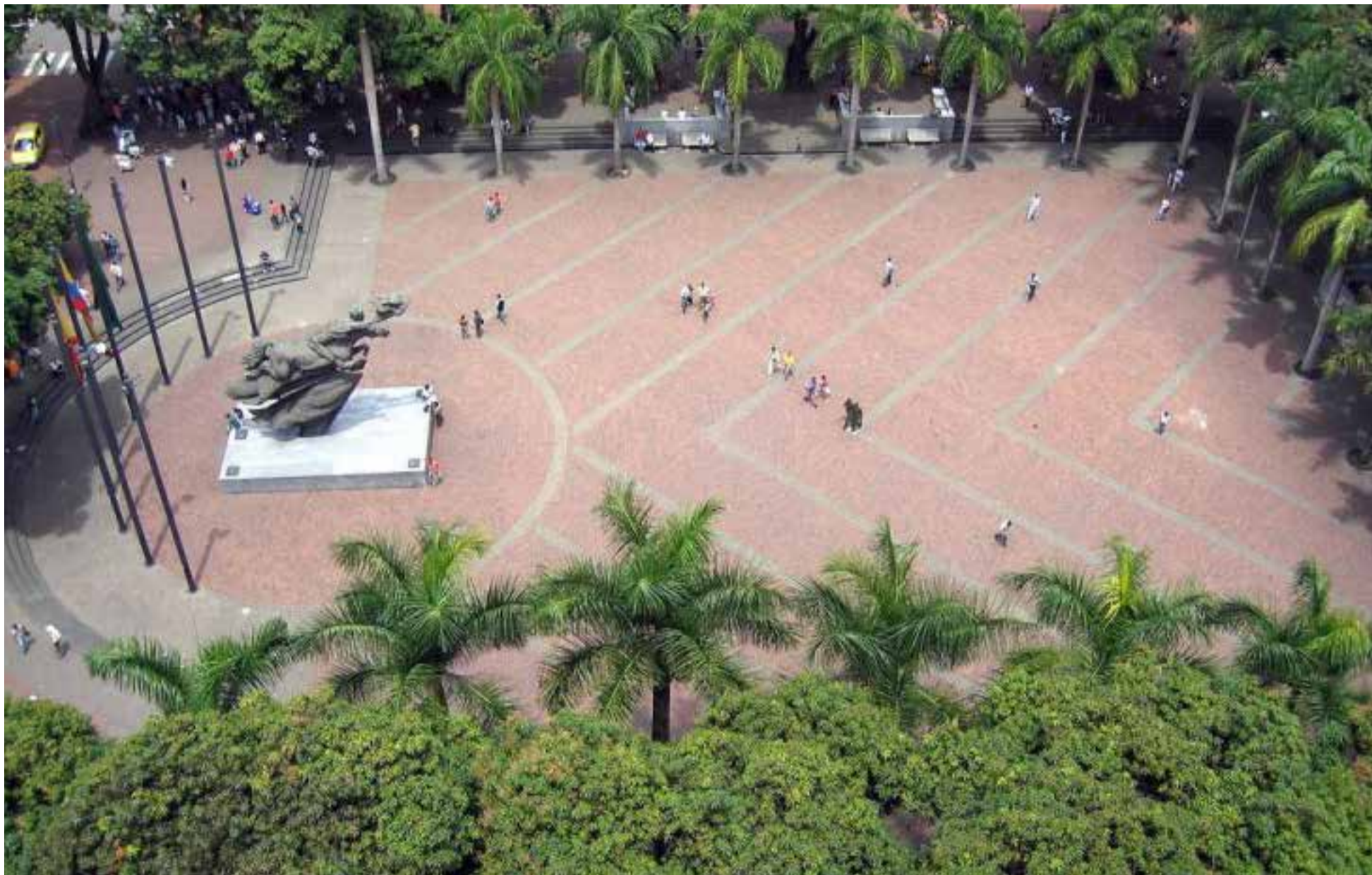
Bolívar desnuda en la plaza principal de Pereira.

economía local. Aunque el café sigue siendo un pilar importante, la región ha diversificado su producción agrícola hacia otros productos como aguacate, plátano y frutas tropicales.