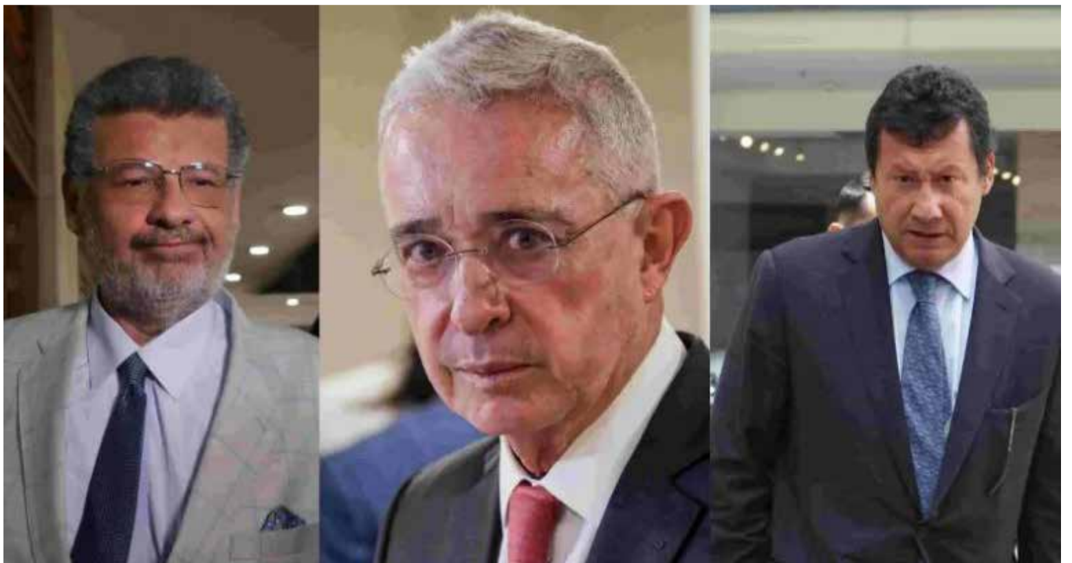
Álvaro Uribe y sus abogados Granados y Lombana, que hacen parte del equipo de la defensa.

Uribe reconoció que sus palabras fueron inapropiadas y que lamentaba haberlas pronunciado.