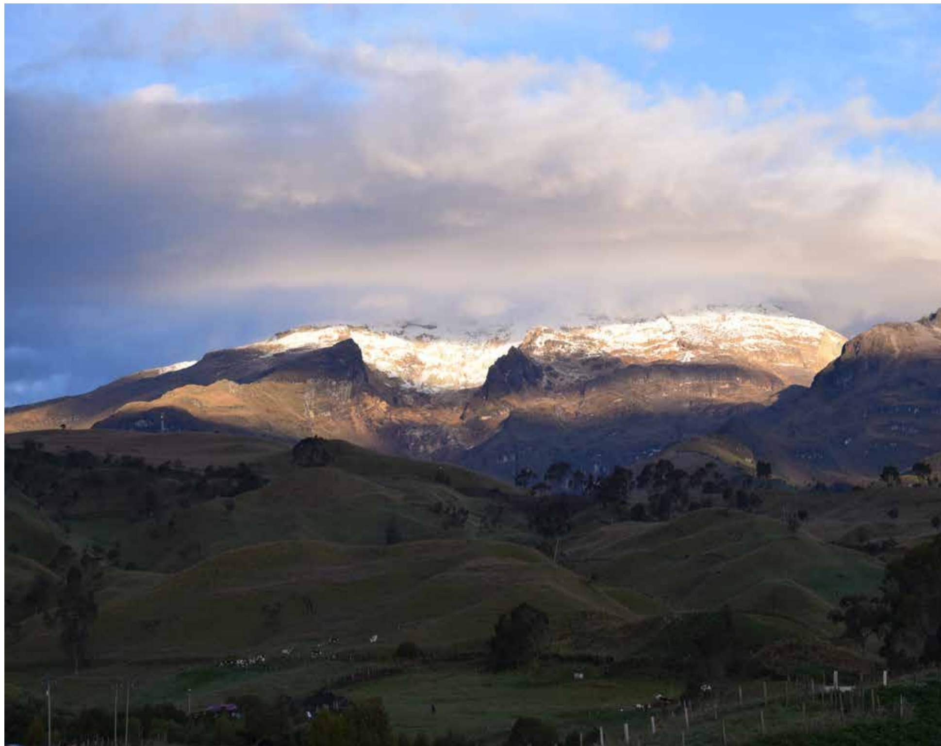
Vista panorámica del Volcán Nevado del Ruiz