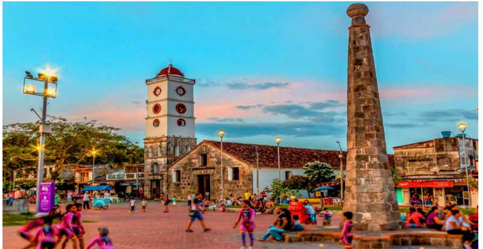
El Paraíso bajo la Especie de una Biblioteca en Mariquita

Aquí transcurrió parte de la Segunda Expedición Botánica del Nuevo Reino de Granada (la primera abarcó los reinos de Chile y Perú y la tercera lo que entonces era México e islas caribeñas), planeada y dirigida por el sabio José Celestino Mutis, animada por Real Cédula de Carlos III. Tarea que consiguió la descripción de casi tres mil especies y variedades de plantas, el dibujo de más