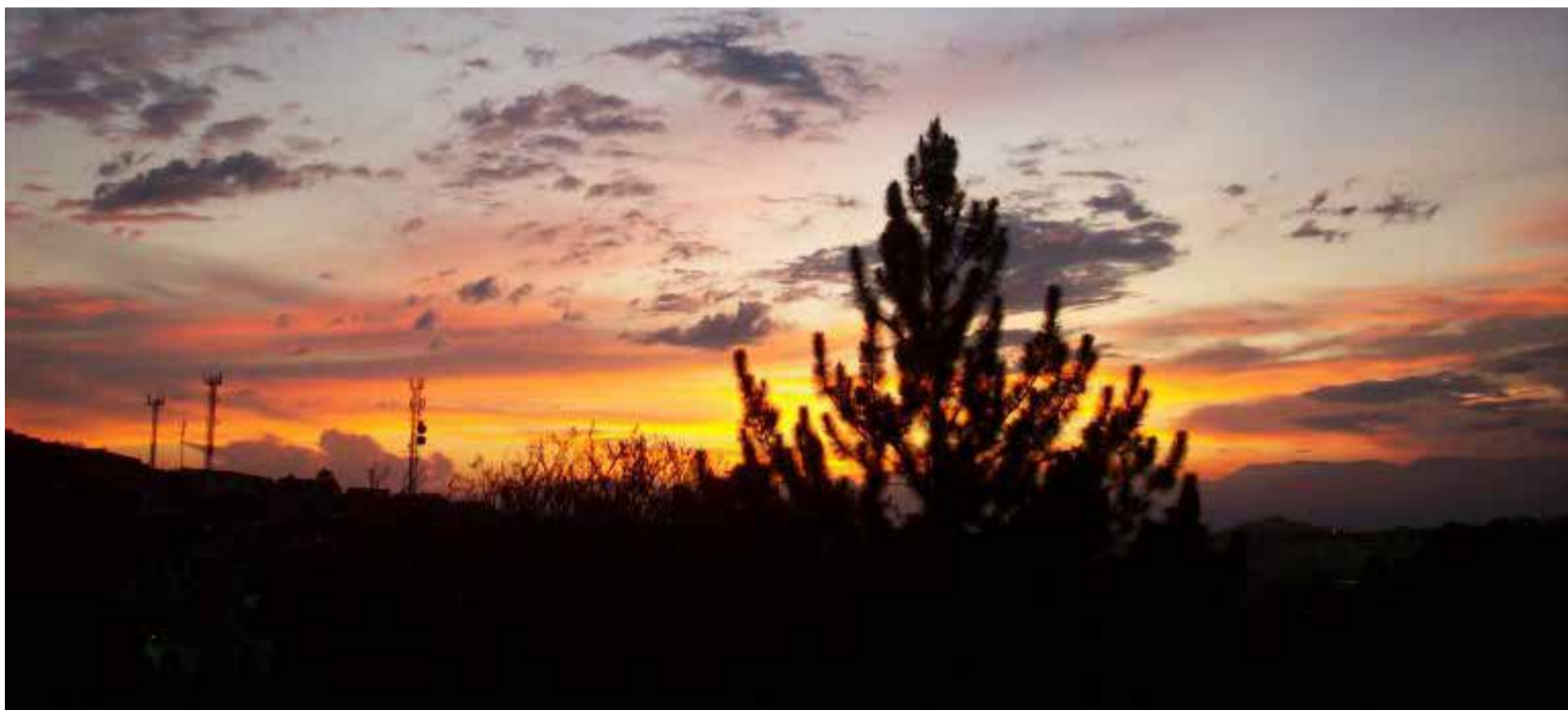
Atardecer en Pereira